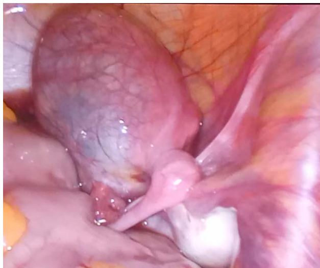
Рис. 3. Лапароскопическая картина: перекрученная киста правого яичника с признаками ишемии (синюшная окраска, отек тканей)

Fig. 3. Laparoscopic picture: twisted cyst of the right ovary with signs of ischemia (cyanotic coloration, tissue edema)