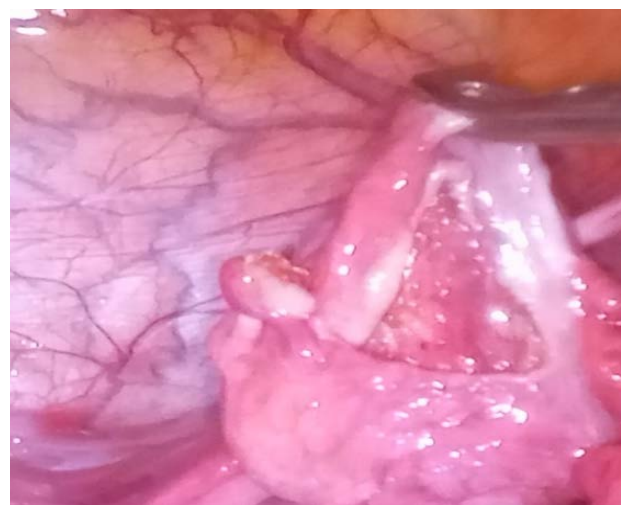
Рис. 5. Лапароскопическое удаление кисты яичника: выделение капсулы кисты; удаление кистозного образования с сохранением здоровой ткани яичника

Предложенная нами стадийная классификация позволяет объективно оценить тяжесть состояния и прогнозировать исходы лечения. Показано, что время до операции критически влияет на возможность органосохранения: при III стадии только 65 % операций завершились сохранением придатка против 100 % в I–II стадиях. Аналогичные данные приводят J. Anders и E. Powell (2005), подчеркивая важность раннего хирургического вмешательства для сохранения функции яичника [13].