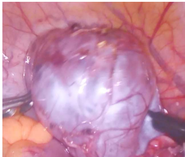
Рис. 4. Этапы лапароскопической деторсии: захват перекрученного придатка atraуматичными щипцами; процесс деторсии кисты яичника

Fig. 3. Laparoscopic picture: twisted cyst of the right ovary with signs of ischemia (cyanotic coloration, tissue edema)